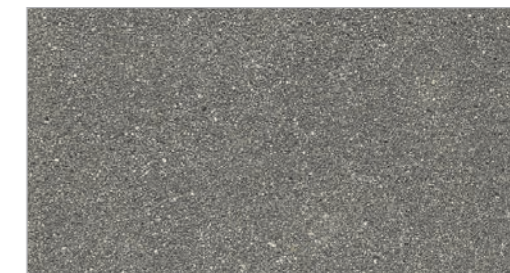
Dark Coal STC-35 Charbon foncé