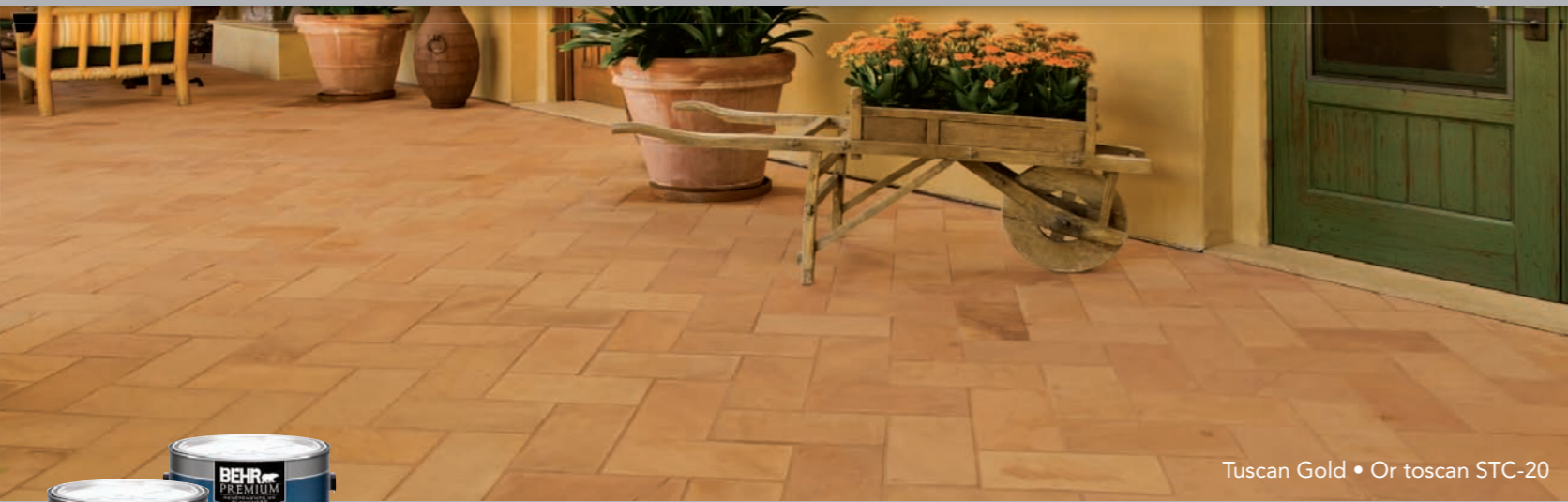
Tuscan Gold • Or toscan STC-20