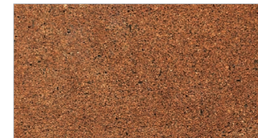
Warm Shale STC-21 Schiste chaud