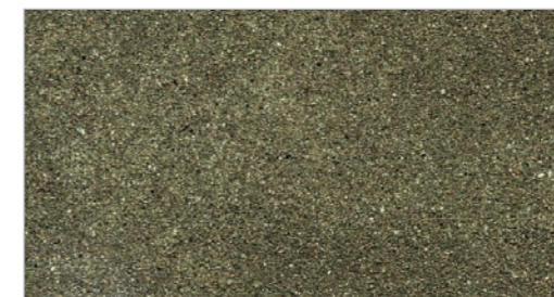
Stone Moss STC-25 Mousse de pierre