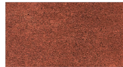
English Brick STC-33 Brique anglaise