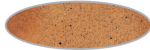
Terra Cotta Glaze • Glacis terra cotta STC-30

WITH CONCRETE STAIN AVEC TEINTURE POUR BÉTON