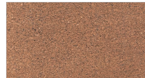
Sunbaked Clay STC-12 Argile cuite au soleil