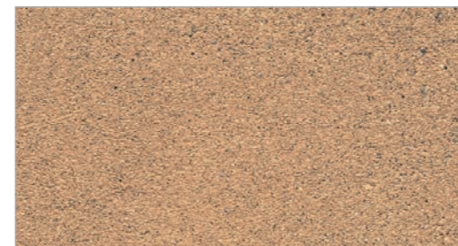
Desert Flagstone STC-10 Dalle du désert