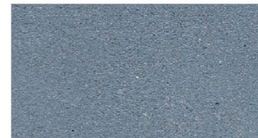
Blue Boulder STC-24 Rocher bleu