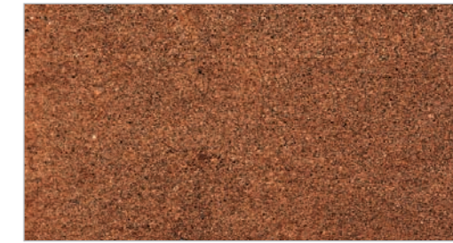
Moroccan Dunes STC-23 Dunes marocaines