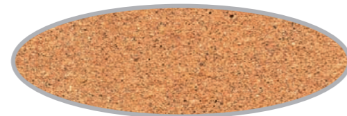
Terra Cotta Glaze • Glacis terra cotta STC-30

WITH CONCRETE STAIN AVEC TEINTURE POUR BÉTON