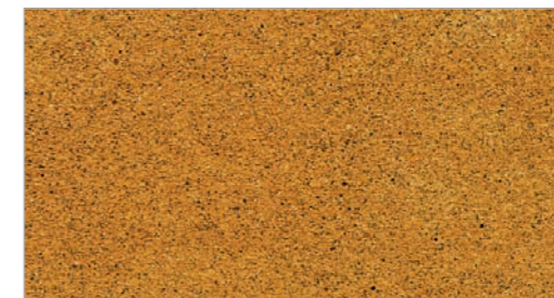
Tuscan Gold STC-20 Or toscan