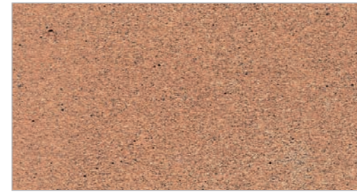
Saltillo Tile STC-13 Tuile saltillo