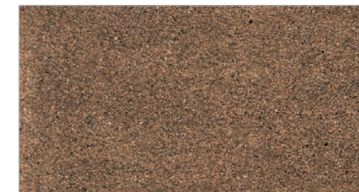
Loden STC-22 Loden