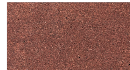
Chicory STC-32 Chicorée