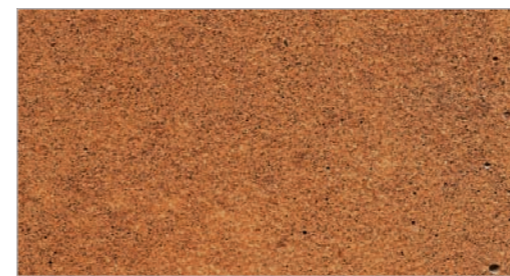
Terra Cotta Glaze STC-30 Glacis terra cotta

Appliquez uniformément sur la surface avec un pulvérisateur à pompe et repassez au rouleau jusqu'à l'obtention d'un fini lisse et uni.