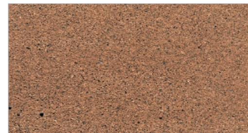
Grotto STC-11 Grotte