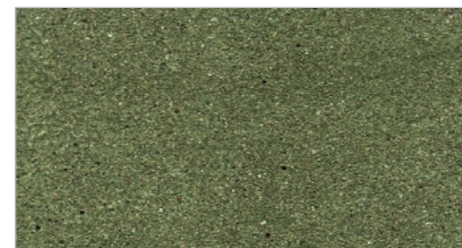
Forest Slate STC-15 Ardoise de forêt