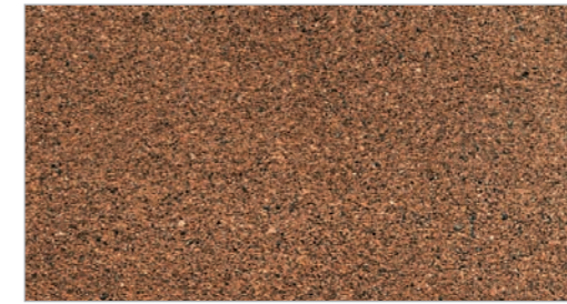
Natural Henna STC-31 Henné naturel